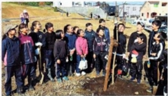
「中学生になってもずっとチームメイトでいたい」と話し、よく植樹したバレーボールチームの小学生 山形会場